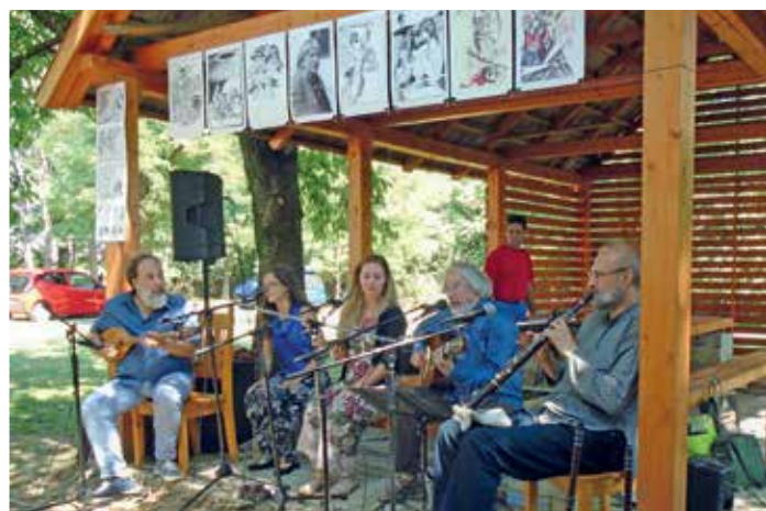
A Sebő együttes az emléknapi díszvendége