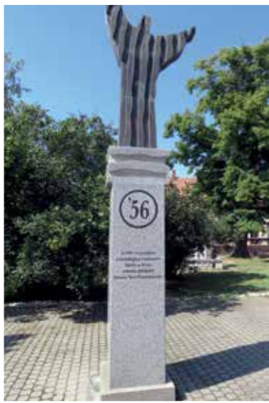
Az '56-os oszlopon elkészült a felirat