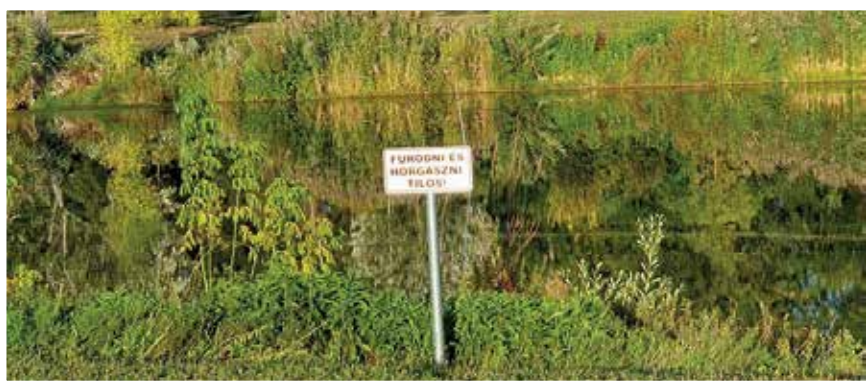
A tó partjára kerültek a figyelmeztető táblák

Köszönjük az intézkedéseket és az elvégzett munkákat! Ismételten kérjük az esővíz elfolyását megakadályozó szegőkövek kivetését!