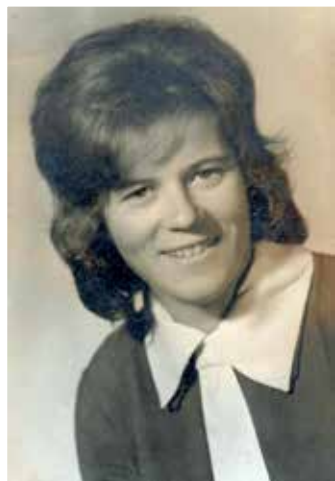
A menyasszony 1964-ben