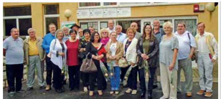
Csoportkép az iskola előtt