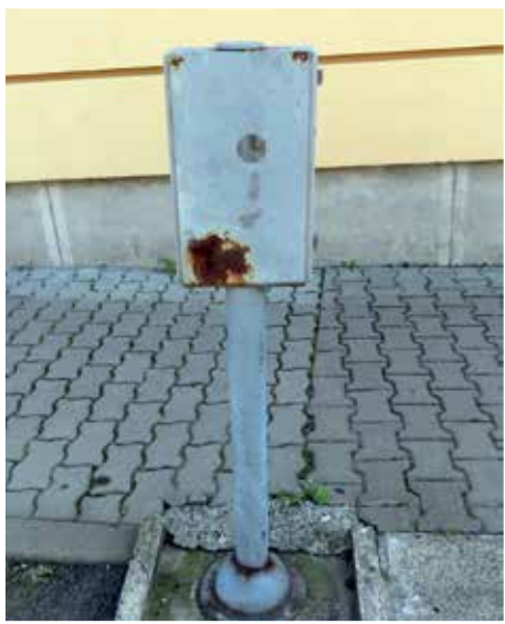
Felállították a kábeleket tartó oszlopot

2018. novemberi számunkban olvasóink felhívták a figyelmet a városunkban tapasztalt néhány hiányosságra, hibára. Örömmel tapasztaljuk, hogy javaslatuk nagy részét megvalósították: