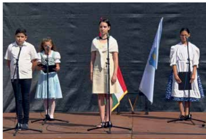
Devecseri iskolások műsora