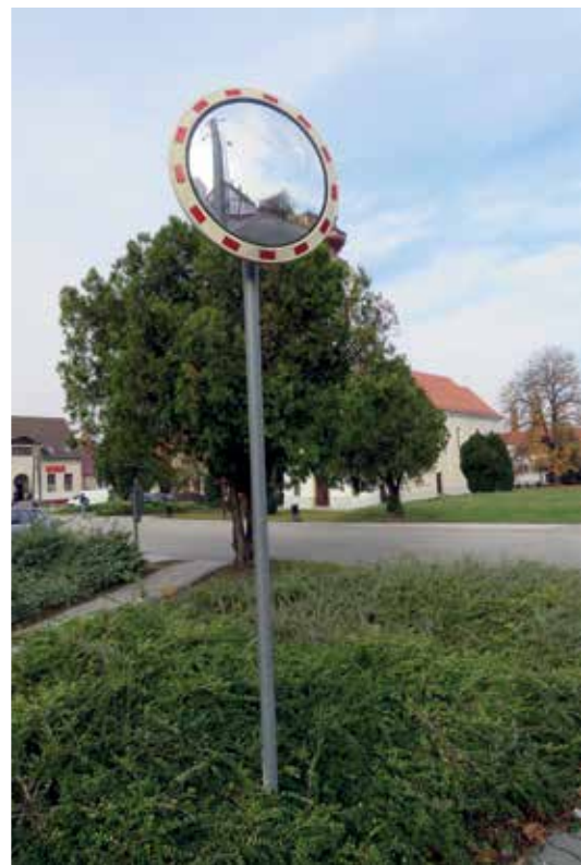
A „Fekete Farkas” sarkán lévő közlekedési tükör – az illetékesek közlése szerint - az autóbusszvezetőket segíti