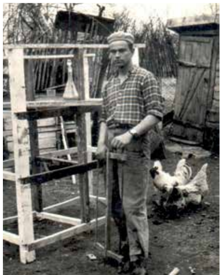
Gyakorlat a szakmához