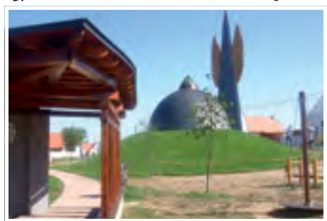
Épül a szárnyas kápolna, Makovecz Imre utolsó álma

„A napokban megkezdődött a vörösiszap sújtotta lakóépületek elbontása. A katasztrófavédelem egyik munkatársa vezetett bennünket képviselő-