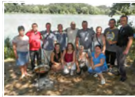
Főzőverseny Nagypalád-Fertősalmás csapata