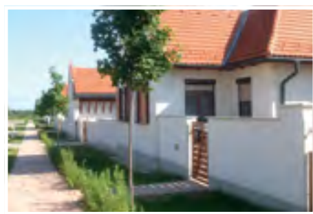
A bakonyi építészeti szépségei a lakóházak

ket a múlt utcáin. Borzasztó érzés volt látni az eltűnt Mórincz Zsigmond-közt, ahol most hatalmas erőgépek „falják” a tömérdek törmelékét. Az utca végén a még álló házaknál teherautók sorakoznak, bútorokat raknak fel a platókra. Az ott élők barátsággal invitálnak be bennünket, hogy nézzük meg otthonukat, amelyet el kell