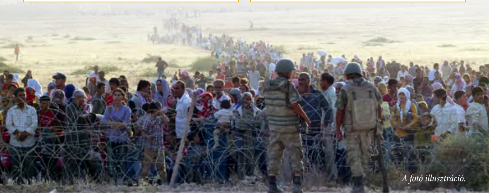
A fotó illusztráció.